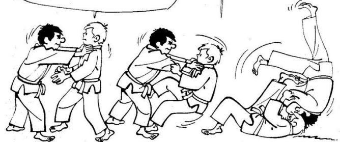
10 DÉFENSE CONTRE SAISIE A LA GORGE par tomoe-nage

... JE ME JETTE ALORS SOUS LUI EN PLAÇANT MON PIED SUR SON AINE ET JE LE PROJETTE AVEC TOMOE-NAGE.