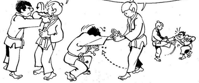
17 DÉFENSE CONTRE SAISIE DES DEUX MAINS A LA GORGE par torsion de la main et atémi du pied.

... SOUS LA PALME. JE RETOURNE SA MAIN VERS LE HAUT EN LA SOULEVANT, PUIS JE LA PRENDS ÉGALEMENT AVEC MON AUTRE MAIN, SYMÉTRIQUEMENT. JE FORCE L'ADVERSAIRE A SE BAISSER ET JE LUI PORTE UN ATÉMI DU PIED AU VISAGE.