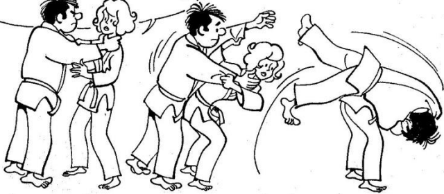
DÉFENSE CONTRE SAISIE A LA GORGE, par Sode-tsurikomi-goshi

SI L'ADVERSAIRE EST PLUS GRAND QUE SOI, OU S'IL SE TIEN TROP PRÈS, ON L'ÉLOIGNE SOIT AVEC UN ATÉMI DU PIED, SOIT UN ATÉMI DU GENOU AU BAG-VENTRE