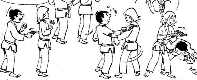
DÉFENSE CONTRE MENACE DE DOS AVEC REVOLVER, par ude-garami

L'ADVERSAIRE TIÈNT SON ARME À BOUT PORTANT DANS MON DOS. JE PIVOTE ET DANS LE MÊME TEMPS, J'ÉCARTE LE REVOLVER EN LE REPRESSANT VERS L'EXTÉRIEUR AVEC LE HAUT DE MON BRAS, EN LÈVANT MON COUDE ... HÉHO! ... CONTINUANT À TOURNER MON CORPS, JE GLISSE MON BRAS SOUS CELUI DE L'ADVERSAIRE ET JE LE Pousse EN TORSION, CE QUI L'OBLIGE À SE PENCHE EN AVANT. JE CONTINUE À PIVOTER ET JE REPLIE SON BRAS DANS SON DOS EN CLÉ DE BRAS: UDE-GARAMI